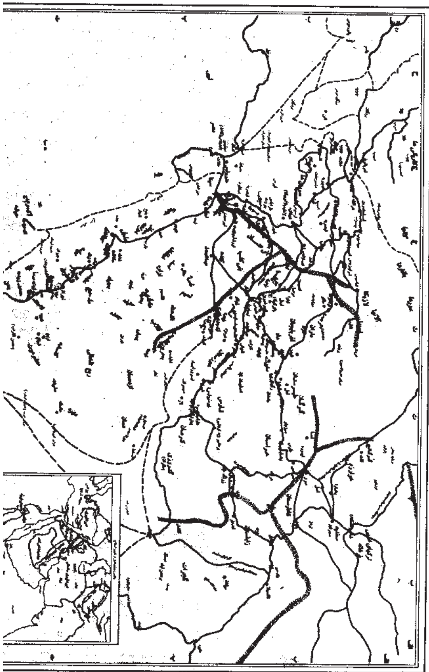
نقشه خاورمیانه در زمان هجرت رسول اکرم (ص) (سال ۶۲۲ میلادی)